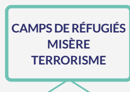
Image des réfugiés