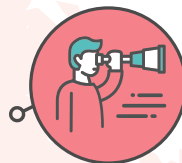
Découverte des métiers