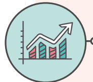
Développement de l'esprit entrepreneurial