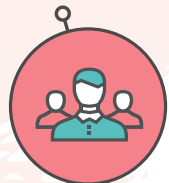
Accompagnement d'une association dans ses missions quotidiennes (recrutement, stratégie...)