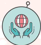
Accompagnement de bénéficiaires (parrainage, coaching, ateliers...)