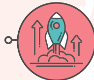
Parrainage de projets associatifs lauréats de l'appel à projets

Les missions ont des formats divers, de 2 heures à une demi-journée. Elles sont limitées à 4 demi-journées avec l'accord du manager.