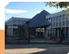
Le collège Lamartine de Villeurbanne